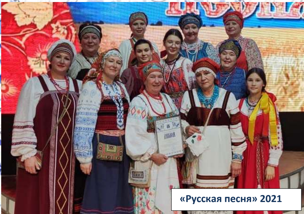
«Русская песня» 2021