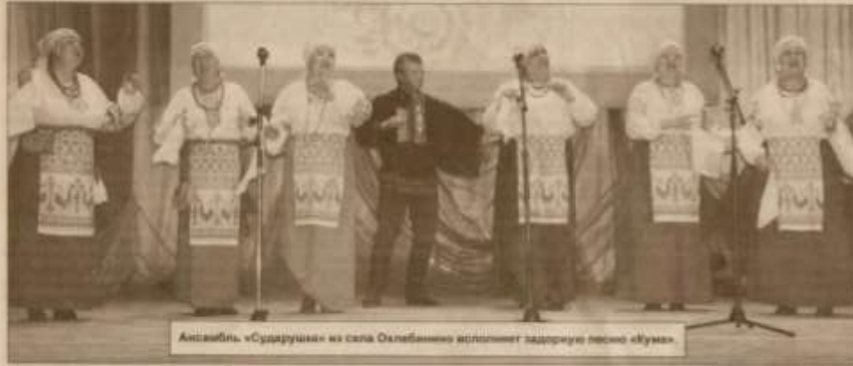
Ансамбль «Сударушка» из села Окебанино исполняет записную песню «Кума»

Накануне первенских праздников в сале Илтино в РДК прошел районный этап республиканского Фестиваля художественно-самодеятельного творчества людей старшего поколения «Я люблю тебя, жизнь!».