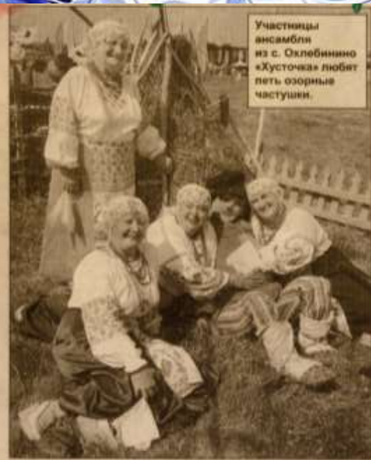
Участницы ансамбля из с. Охлебинино «Хусточка» любят петь озорные частушки.