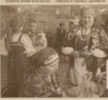
События прошли в концертном зале музыкального колледжа

Суть народных песенных традиций Косовского района. Это были музыкальные произведения, посвященные творчеству Г. М. Бондарева, которые были исполнены в концертном зале музыкального колледжа. Это были музыкальные произведения, посвященные творчеству Г. М. Бондарева, которые были исполнены в концертном зале музыкального колледжа.