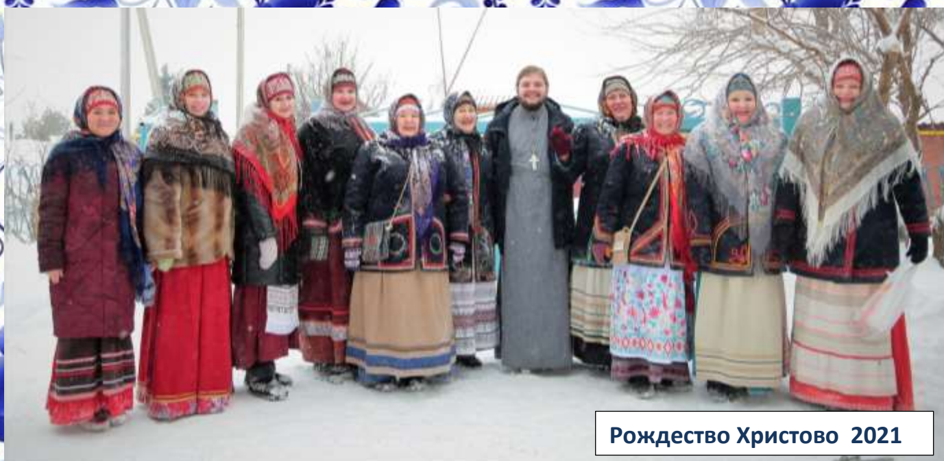
Рождество Христово 2021