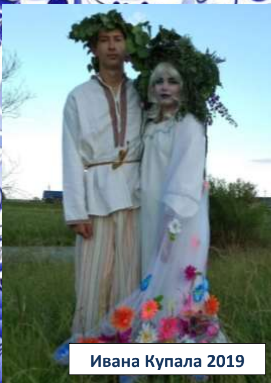
Ивана Купала 2019