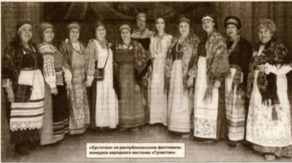
«Хусточка» на республиканском фестивале-конкурсе народного костюма «Гулистан».