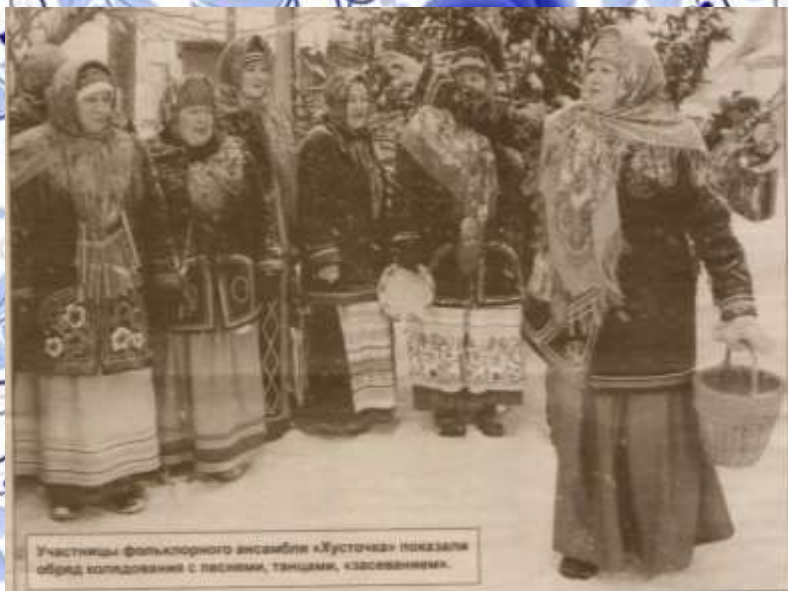
Участники фольклорного ансамбля «Звучеца» показали обряд колдования с песнями, танцами, «засеванием».

Милуша ГАРАЕВА, Фото администрации Итинского района