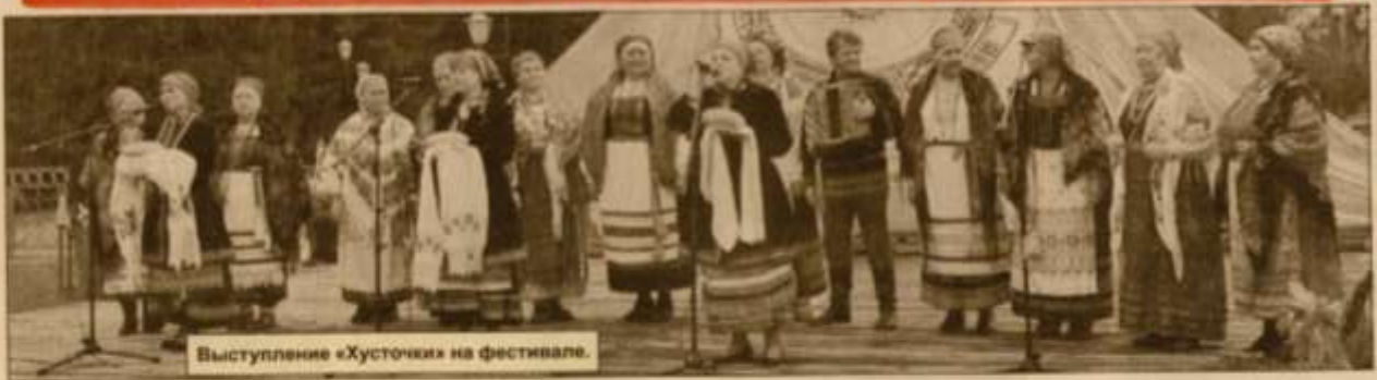
Выступление «Хусточки» на фестивале.

Народный фольклорный ансамбль «Хусточка» (руководитель В. Кобыков) сельского Дома культуры с. Охлебинино принял участие в третьем межрегиональном фестивале-лаборатории русского фольклора «Народный календарь».