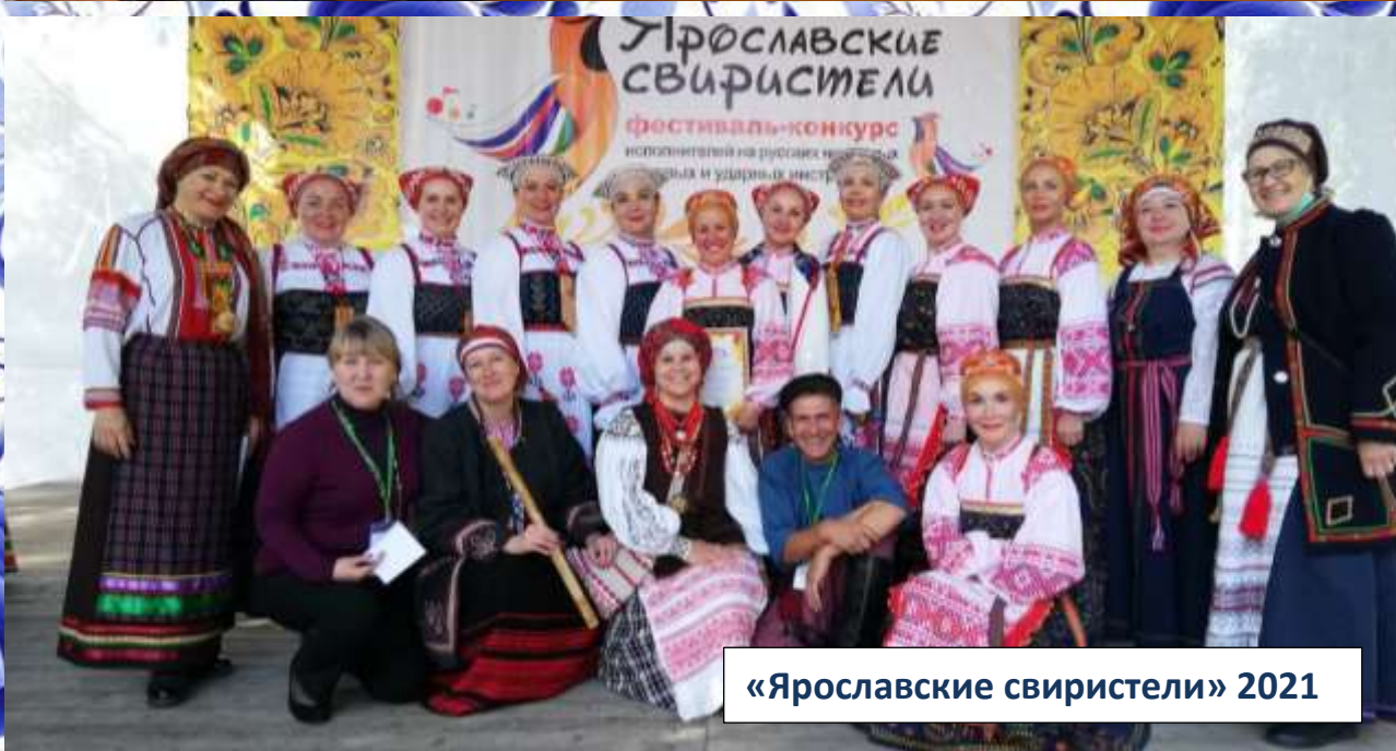
«Ярославские свиристели» 2021