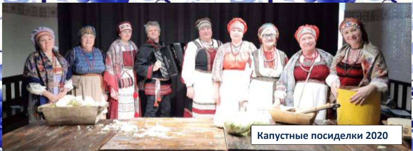
Капустные посиделки 2020