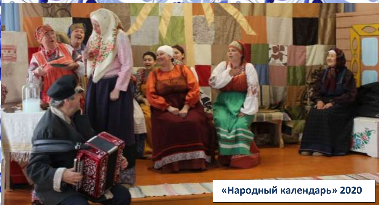
«Народный календарь» 2020