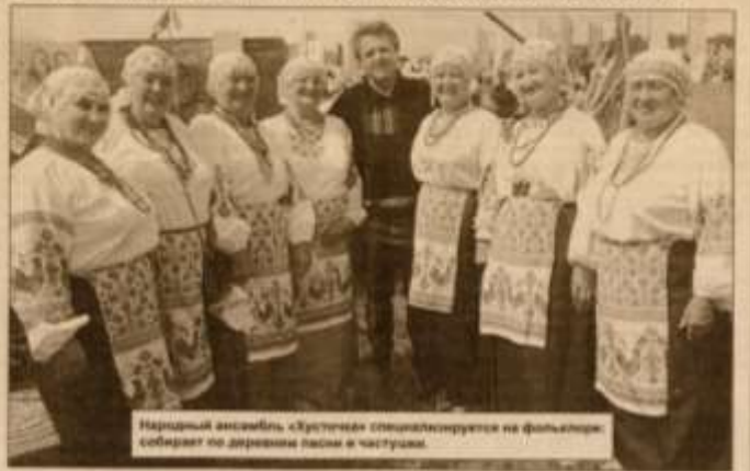
Народный ансамбль «Хусточка» специализируется на фольклоре, собирает по деревням песни и частушки.

призывали организаторы участников фестиваля родовых поместий