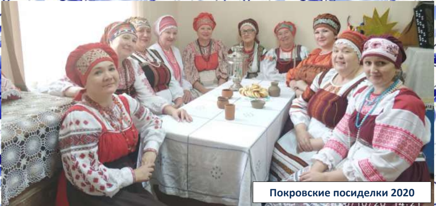
Покровские посиделки 2020