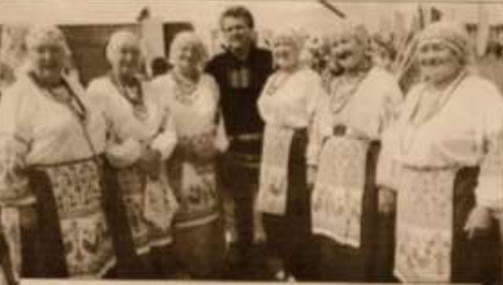
Фольклорный ансамбль «Хусточка» участвует в праздничном концерте ко Дню республики

На сцену вышло творческое коллективное творчество Косовского района Г. М. Бондарева. Творчество коллектива представило в концертном зале музыкальные произведения, посвященные творчеству Г. М. Бондарева. Это были музыкальные произведения, посвященные творчеству Г. М. Бондарева, которые были исполнены в концертном зале музыкального колледжа. Это были музыкальные произведения, посвященные творчеству Г. М. Бондарева, которые были исполнены в концертном зале музыкального колледжа.