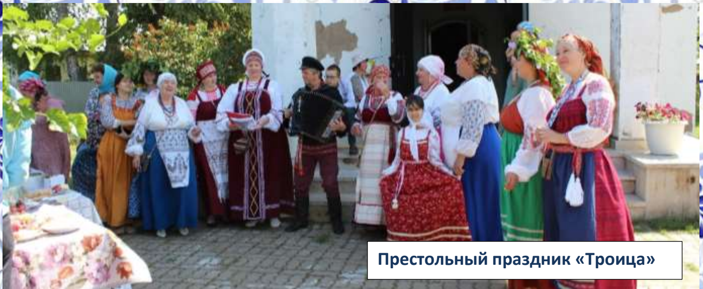
Престольный праздник «Троица»